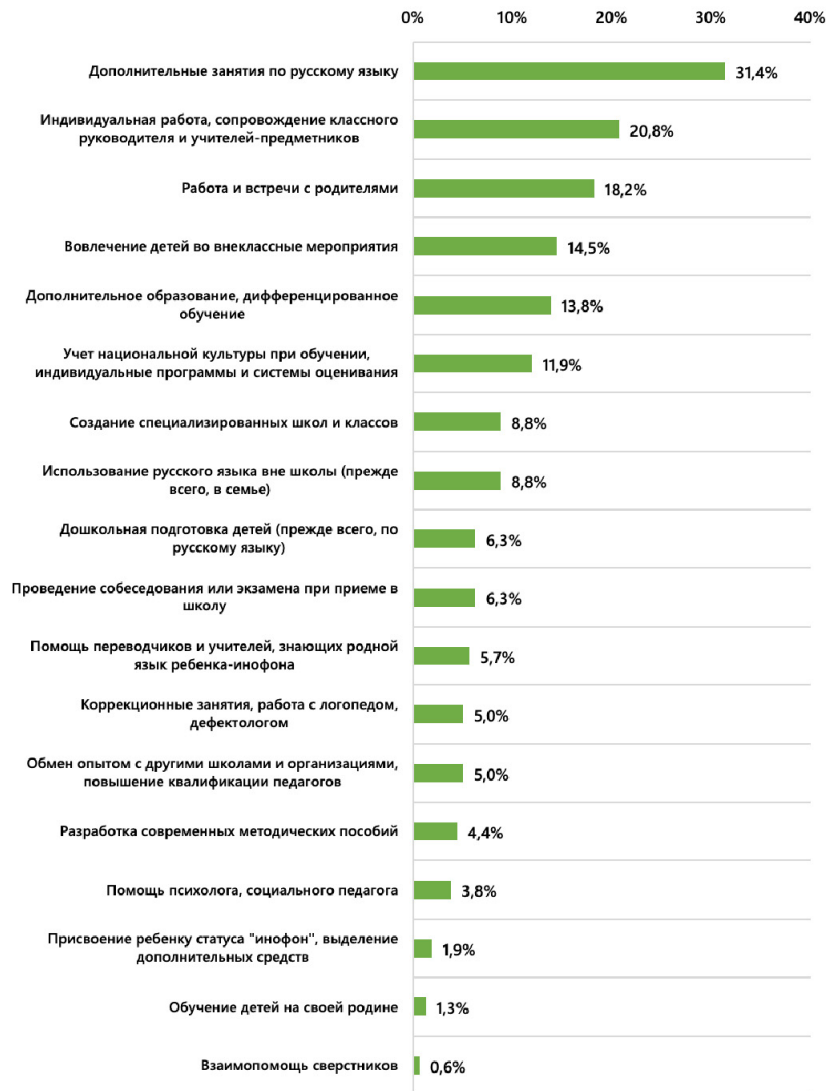
Рис. 3. «Какие пути решения проблем обучения детей-инофонов Вы считаете наиболее эффективными?» Контент-анализ ответов на открытый вопрос