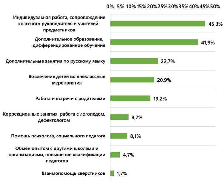
Рис. 2. «Какие меры предпринимаются в Вашей школе для преодоления трудностей в обучении детей-инофонов?» Контент-анализ ответов на открытый вопрос

тельные маршруты для инофонов по изучению русского языка. В школах с большим количеством детей-инофонов формируются отдельные структуры и подразделения, нацеленные на языковую и социокультурную адаптацию инофонов. Наряду с этим школы сотрудничают с учреждениями дополнительного образования, реализующими курсы по изучению русского языка.